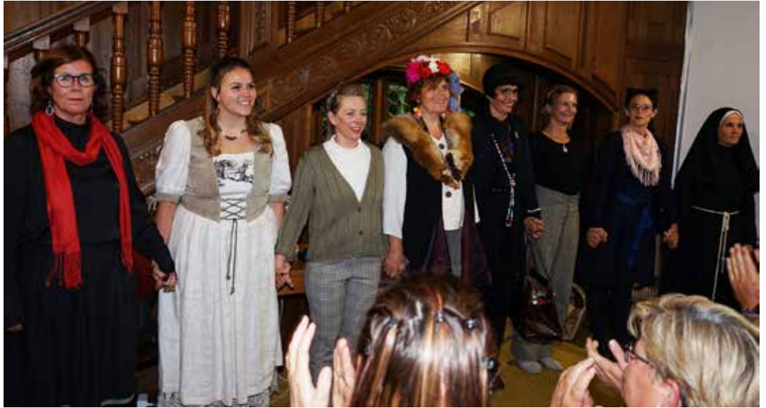
Das Ensemble der Kult(UR)-Frauen im Museum.

Im Sommer 2018 wagten sich die Arlberger Kulturtage an einen Klassiker der Theaterbühnen, an „Die Mausefalle“ von Agatha Christie, das am längsten, ununterbrochen aufgeführte Theaterstück der Welt. Das Stück wurde von den Arlberger Kult(Ur)frauen in gewohnter Art und Weise dem Aufführungsort und dem Ensemble angepasst. Die Mausefalle ist ein Krimi der zum Mitraten einlädt.