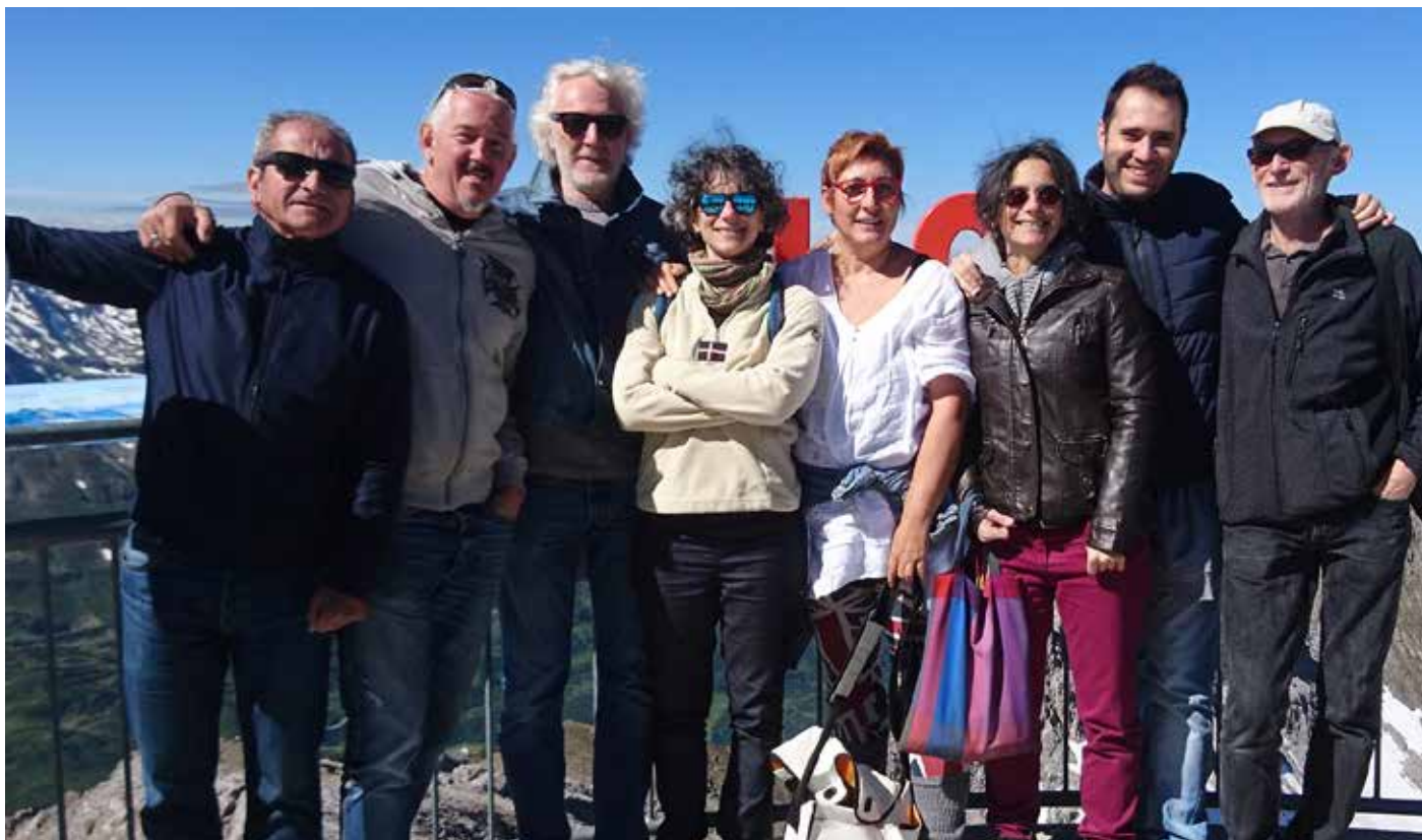
Einige Künstlerinnen und Künstler der AKT 2018 bei einem Ausflug auf die Valluga.