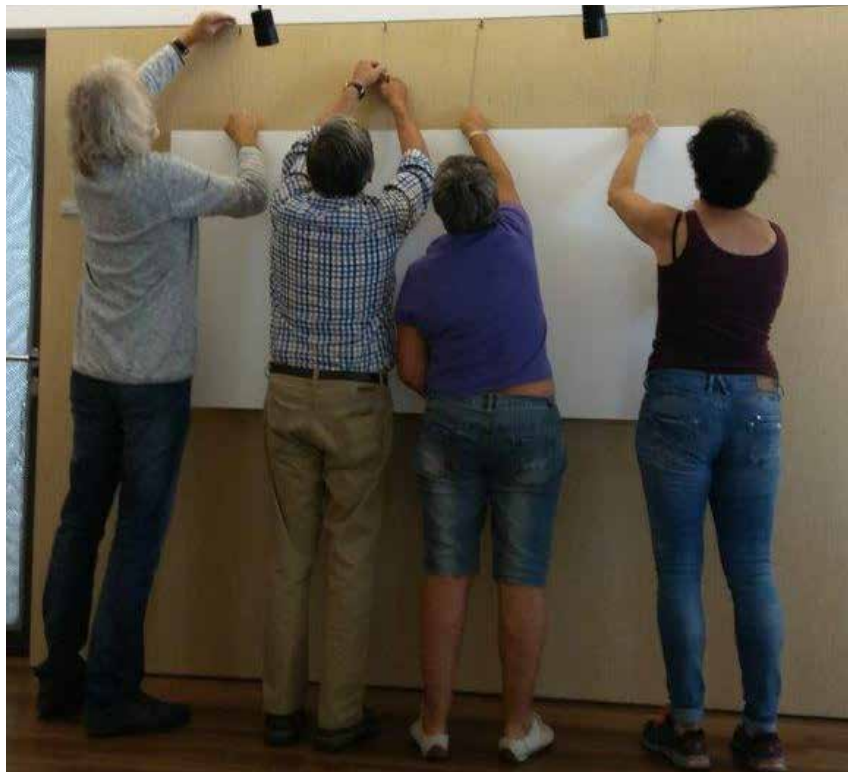
Mit vereinten Kräften beim Ausstellungsaufbau.

Vernissage am 14. August in der Galerie der Raiffeisenbank.