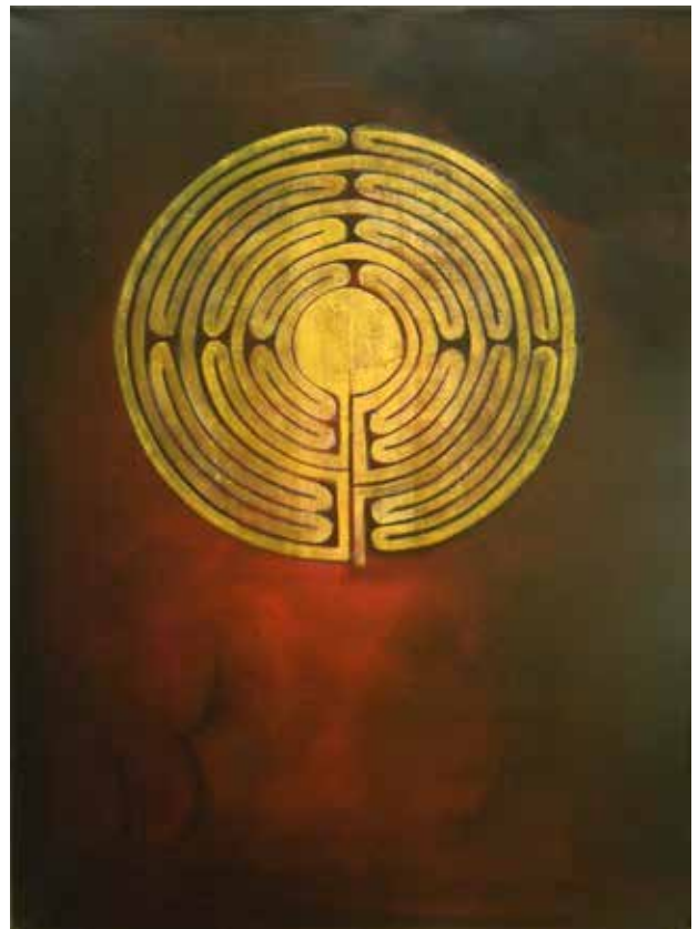
„Transformation“ des Labyrinthes von Chartres.

Unsere Idee war nun, ein Thema oder ein Werk aus der Kunstgeschichte in unsere eigene Arbeit zu transformieren und ganz bewusst damit zu arbeiten. Die 12 teilnehmenden Künstlerinnen und Künstler aus Österreich, Deutschland, Israel, Italien, Ungarn und Bulgarien möchte ich Ihnen nun vorstellen.