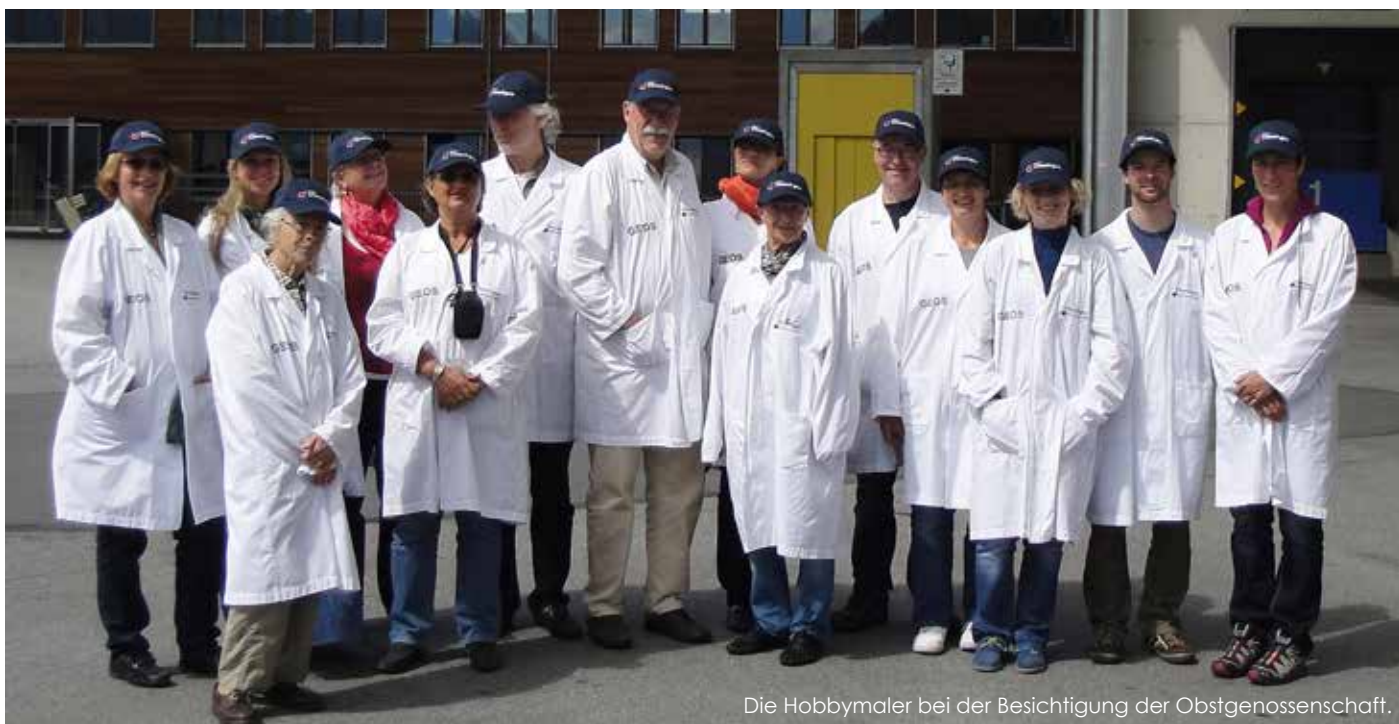
Die Hobbymer bei der Besichtigung der Obstgenossenschaft.