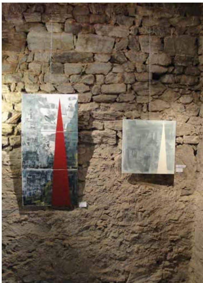
Die Schlandersburg bot ein einmaliges Ambiente für die Ausstellung.