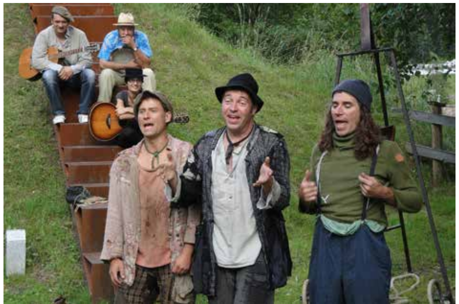
„Concerto alla Scala“ Slapstik mit der Künstlergruppe „Irrwisch“.

Der Verein hatte also allen Grund zu feiern. Er lud seine Mitglieder zu einem Fest ein, welches um 17.00 Uhr in der Kunstmeile begann. Wir erlebten dort an der eisernen Treppe das „Concerto alla Scala“ und einen Auftritt der Akrobatikgruppe „Irrwisch“. Dann folgten im Foyer der Arlberg well.com Halle die Festansprache des Präsidenten und die Grußworte des Bürgermeisters. In der Well.com Halle zeigten wir einen Querschnitt der gesammelten Werke des Vereins. Anschließend lud der Verein die Mitglieder zu Speis und Trank bis in den späten Abend. Leider war der Besuch der Jubiläumsveranstaltung durch unsere Mitglieder äußerst spärlich. Zu später Stunde gab noch die Akrobatengruppe „Irrwisch“ im Zuge des St. Antoner Dorffestes am Griesplatz eine Feuershow zum Besten.