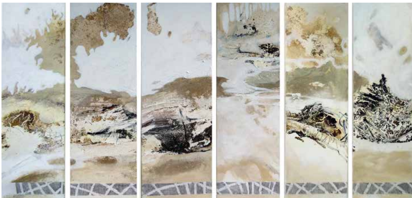
„Berg- und Talfahrt“ Sixtichon von der Künstlergruppe „Insieme“.